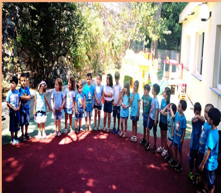
GIOCHI IN GIARDINO