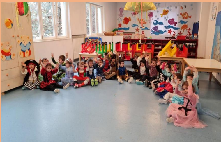
FESTA DI CARNEVALE